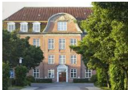
Hovedbygning med indgang til reception