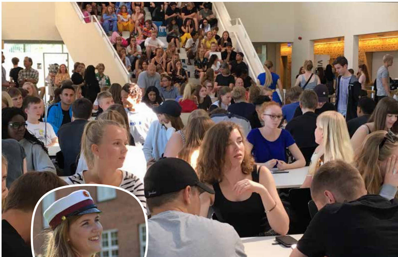
Midtsjællands Gymnasium, Ringsted og Haslev